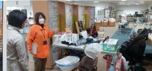
【育児用品リユースの説明】