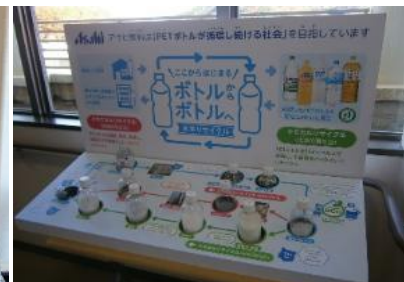
【企業とのPETボトルリサイクル コラボ】